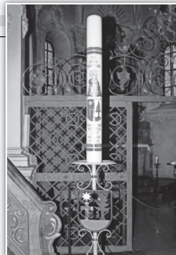
Jubiläumskerze am 14.01.2018