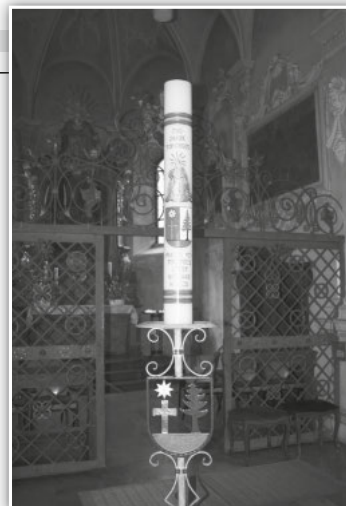
Jubiläumskerze am 02.04.2018

Am Sonntagmorgen, den 29. April 2018 lädt die Trachtenkapelle Todtmoos um 10:45 Uhr in die Klinik Wehrawald zum Konzert ein. Die Musikerinnen und Musiker freuen sich über viele Zuhörer. Der Eintritt ist frei.