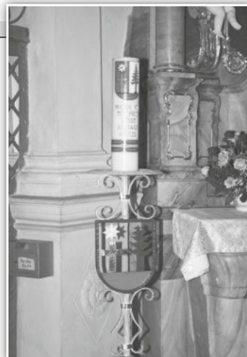
Jubiläumskerze am 14.10.2018