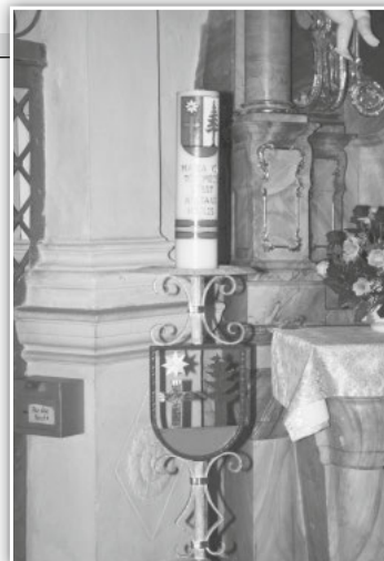
Jubiläumskerze am 14.10.2018

Der Katholische Kirchenchor Todtmoos organisiert zum Abschluss unseres Jubiläumsjahres eine himmlische Bastelaktion. Aus ausgedienten Gotteslobblätter werden Engel für den Schmuck der Weihnachtsbäume in unserer Wahlfahrtskirche gefaltet. Alle Bastelfreunde, Schulkinder und auch unsere Senioren sind herzlich eingeladen mitzumachen. Bis Weihnachten treffen sich alle Engelbastler/innen immer mittwochs um 15:00 Uhr und jeden Freitag um 19:00 Uhr im Pfarrzentrum. Der Kirchenchor freut sich auf Sie!