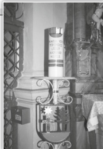
Jubiläumskerze am 25.11.2018

Am Samstag, 08. Dezember 2018 trifft sich die Rentnergemeinschaft zur Weihnachtsfeier im katholischen Pfarrzentrum. Beginn ist um 14:00 Uhr. Es erwartet Sie ein gemütlicher Nachmittag mit Kerzenschein. Neben weihnachtlichen Köstlichkeiten wird auch gemeinsam gesungen. Jüngere Gäste sind herzlich willkommen.