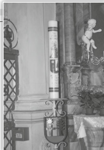
Jubiläumskerze am 01.05.2018