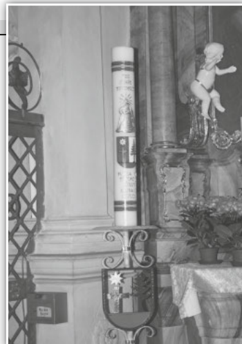
Jubiläumskerze am 01.05.2018