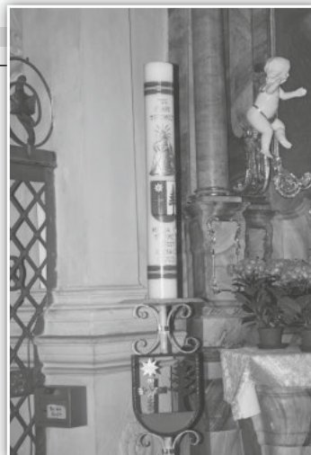
Jubiläumskerze am 01.05.2018

Am Mittwoch, 30. Mai 2018 findet um 20:00 Uhr im „Alten Kurpark“, bei ungünstiger Witterung im Kurhaus Wehratal ein Heimatabend mit unserer Trachtengruppe statt. Bei einem abwechslungsreichen Programm mit Tänzen, Liedern, Mundartgedichten und Glockenspiel wünsche ich Ihnen gute Unterhaltung. Die Trachtengruppe freut sich über viele Gäste und auch über Einheimische. Der Eintritt ist frei.