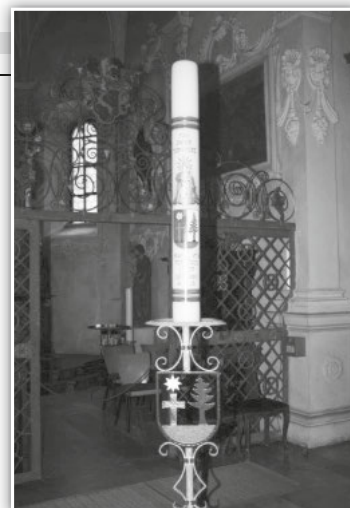
Jubiläumskerze am 04.03.2018