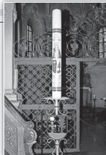
Jubiläumskerze am 14.01.2018