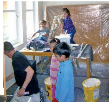
- Die Maler renovieren den Kindergarten unter fachkundiger Anleitung und tatkräftiger Hilfe der anwesenden Kinder -