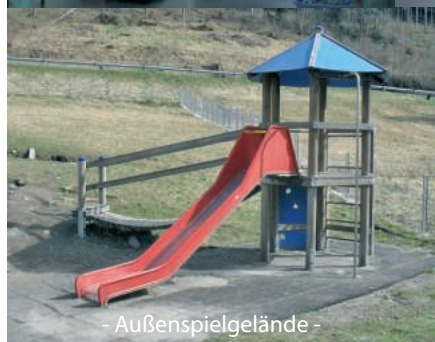
- Außenspielgelände -