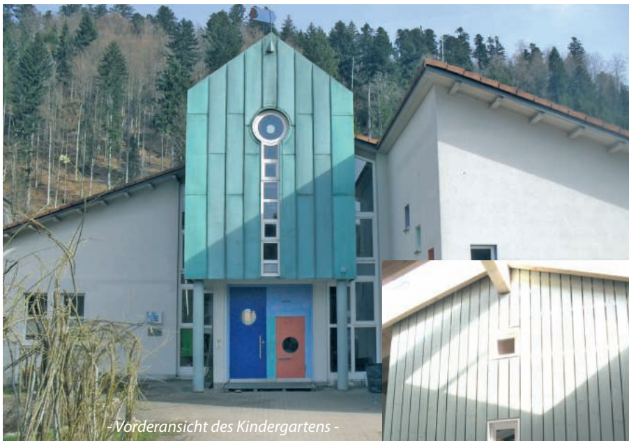
- Vorderansicht des Kindergartens -

Bereits im 20. Jahr können unsere kleinen Mitbürgerinnen und Mitbürger unseren Kindergarten im Häusleweg 15 besuchen.