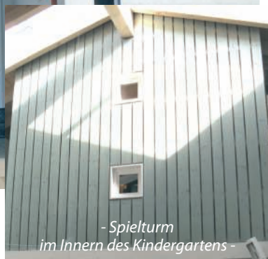
- Spielturm im Innern des Kindergartens -