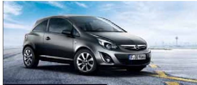
Abb. zeigen Sonderausstattungen.