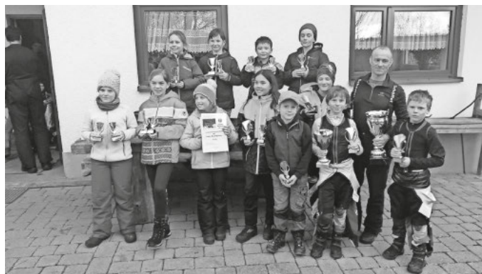
Teilnehmer der Vereinsmeisterschaften Alpin und Nordisch

Am vergangenen Sonntag fand am Wegner Skihang zusammen mit dem Skiclub Wehr die alpine Vereinsmeisterschaft statt. Trotz hauchdünner Schneedecke konnten durch eine super Pistenpräparation alles wie geplant stattfinden. Nach dem Rennen wurde die Grillsaison eröffnet. Danke an den Skiclub Wehr für die Bewirtung in der Hütte.