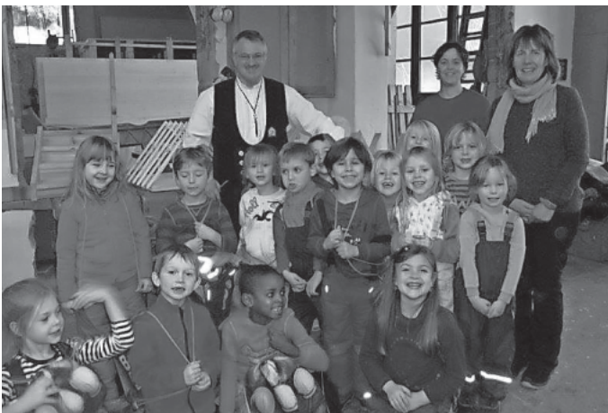
Die Schulanfänger des Kath. Kindergartens St. Elisabeth in Todtmoos