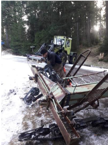
23.01.20: Skilifte Hochkopf werden abgebaut