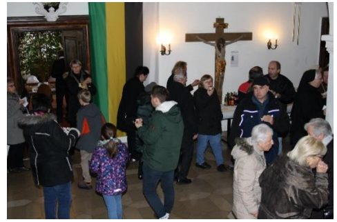
19.01.20: Patrozinium und Klosterfest