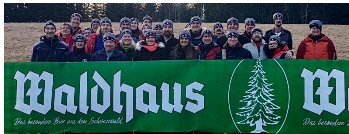
24.01. bis. 26.01.20: „1. Waldhaus Husky-Camp“