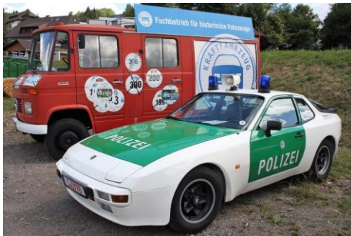
12. + 15.08.20: „Rothaus Schwarzwald Classic“