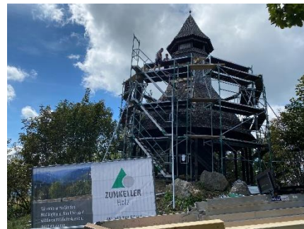
03.09.20: Sanierungsarbeiten am Hochkopfturm beginnen