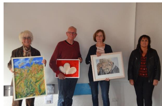
28.10.20: Unsere Künstler präsentieren sich