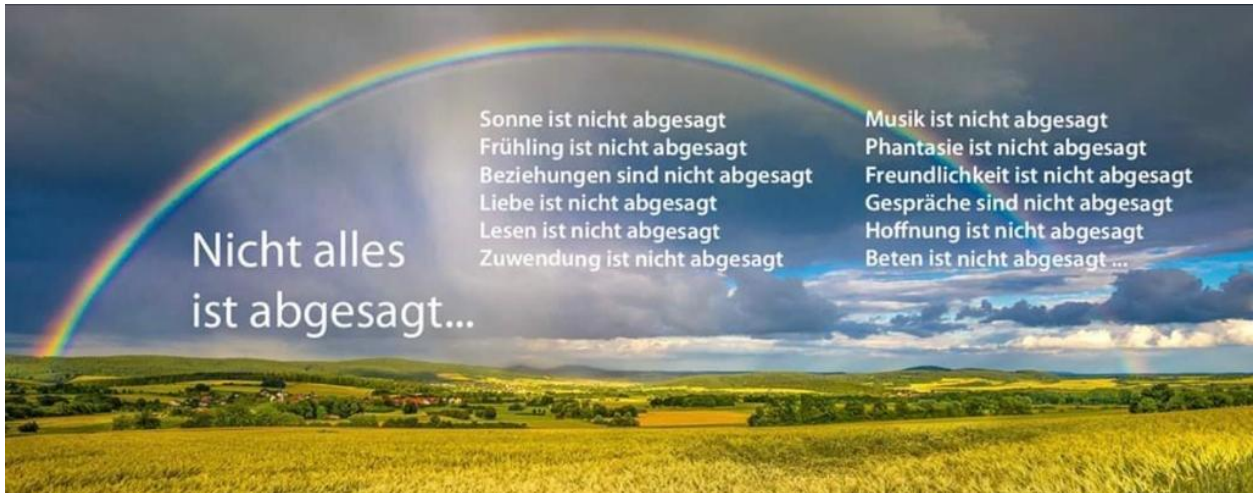
März: Ausbruch des Corona-Virus