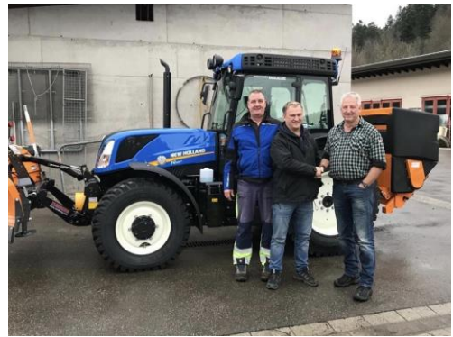
09.01.20: Bauhof erhält neuen Traktor