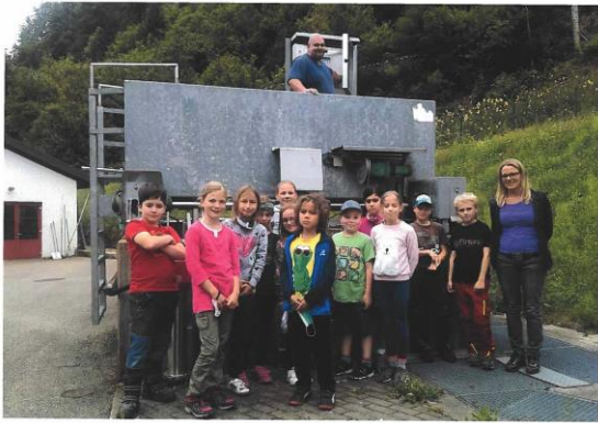
15.07.20: Schüler/innen der Klasse 3 besuchen Kläranlage