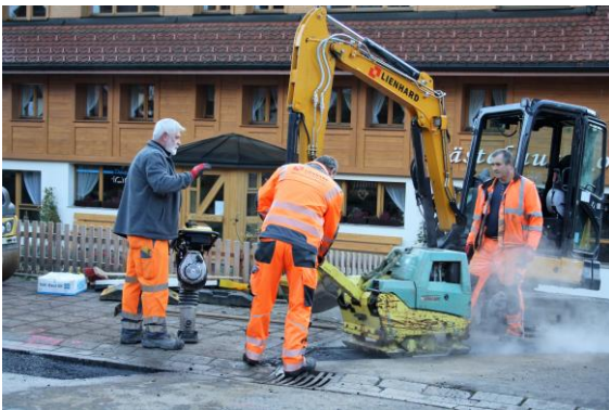
10.11.20: Viele Baustellen im Ort, hier Breitband-Ausbau