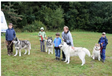
August/September 20: Sommercamp des SSBW