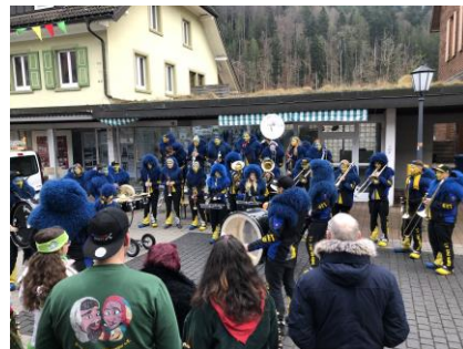
24.02.20: Hafenkonzert Guggen Ensemble