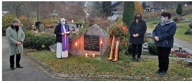
15.11.20: Volkstrauertag mit Kranzniederlegung