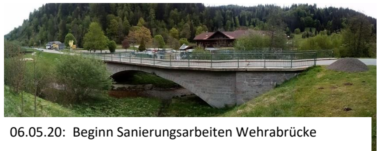
06.05.20: Beginn Sanierungsarbeiten Wehrbrücke