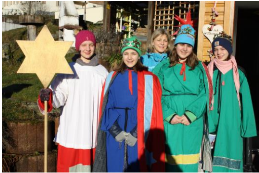
06.01.20: Die Sternsinger sind unterwegs