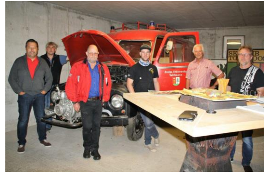
26.07.20: Bildung Interessengemeinschaft Opel-Blitz