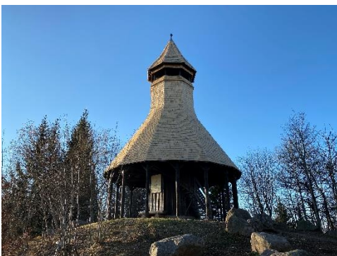
24.11.20: Schindelmantel Hochkopfturm fertig gestellt