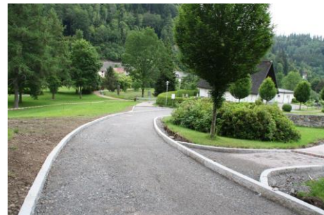
22.06.20: Friedhofsplatz wird fertiggestellt