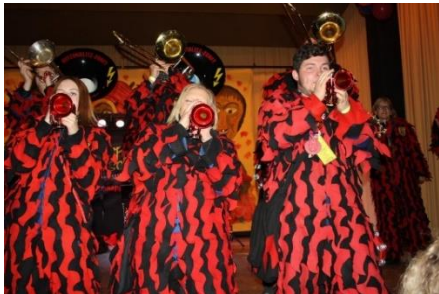
21.02.20: Partynacht in der Wehratalhalle