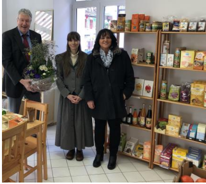
15.02.20: Bio-Laden wird eröffnet