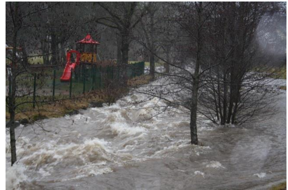
03.02.20: Hochwasser in Todtmoos