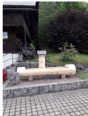
Juli 20: Heimatmuseum erhält neuen Brunnen