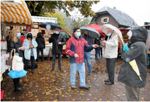
29.10.20: Saisonwochenende Wochenmarkt