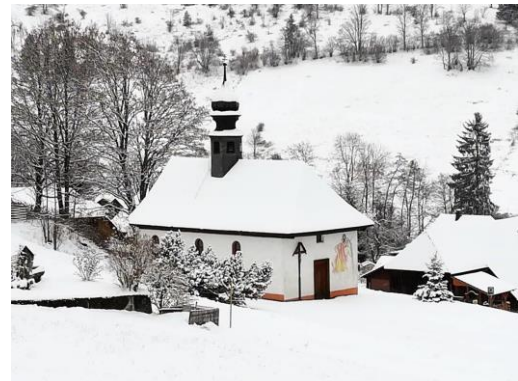
01.12.20: Der erste Schnee