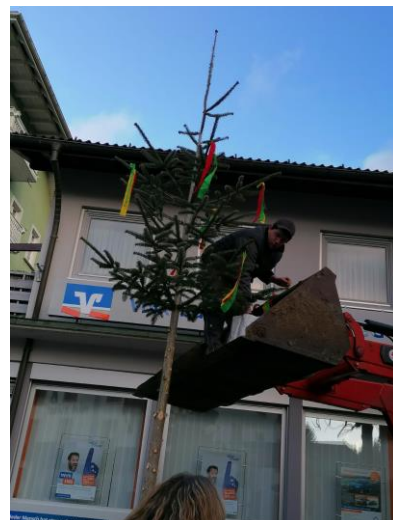
18.01.20: Ort wird fastnachtlich geschmückt