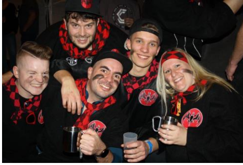
18.01.20: Guggenmusiktreffen Wehratalhalle