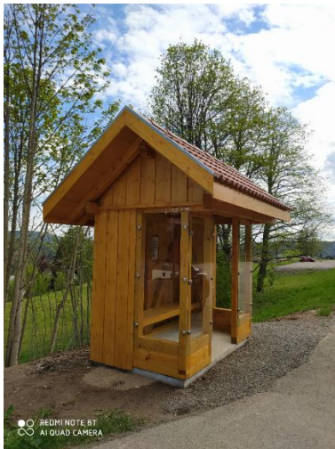
02.05.20: Buswartehäuschen in Prestenberg wurde vom Bauhof angefertigt und aufgestellt