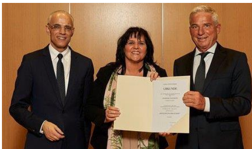
10.01.20: Gemeinde Todtmoos erhält Urkunde zum Zusatz auf Ortsschildern