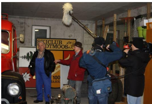
07.02.20: SWR filmt Opel-Blitz der Feuerwehr