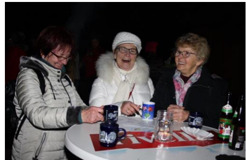
12.01.20: „Licht aus“- Aktion im „Alten Kurpark“