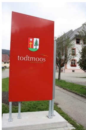
09.10.20: HTG-Stelen mit Logo aufgestellt