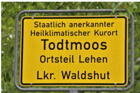
30.06.20: Neue Ortsschilder wurden aufgestellt