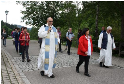
25.05.20: Hornusser Wallfahrt findet im kleinen Rahmen statt