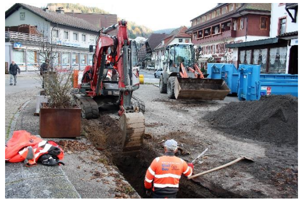
Fernwärmeleitungen werden verlegt