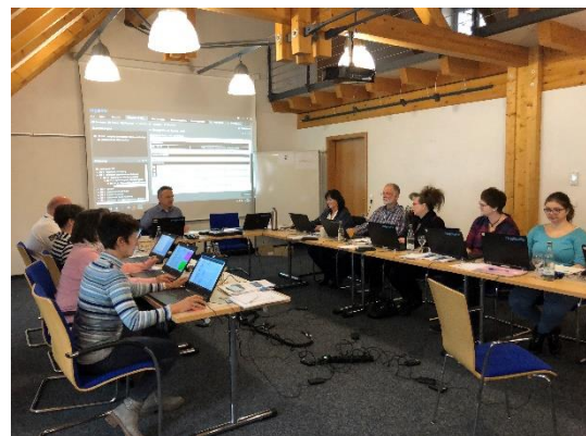
13.02.20: Verwaltung steigt auf digitale Aktenführung um