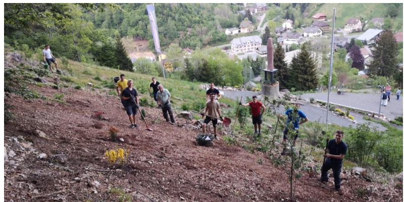
22.05.20: Sportverein gestaltet Platz bei der Marienstatue