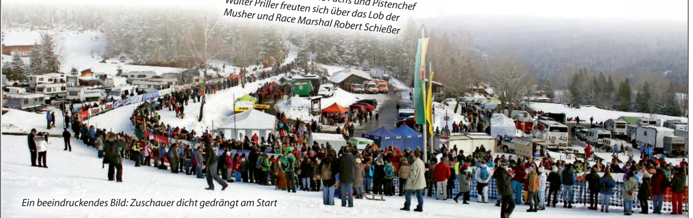
Ein beeindruckendes Bild: Zuschauer dicht gedrängt am Start