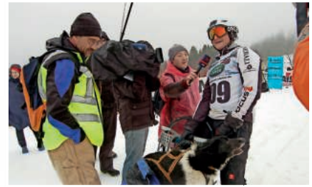
Mehrere Fernsteams begleiteten das Rennwochenende