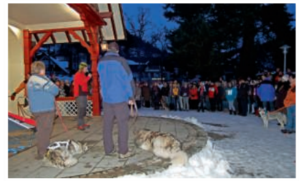
Vorstellung der Schlittenhunde im alten Kurpark