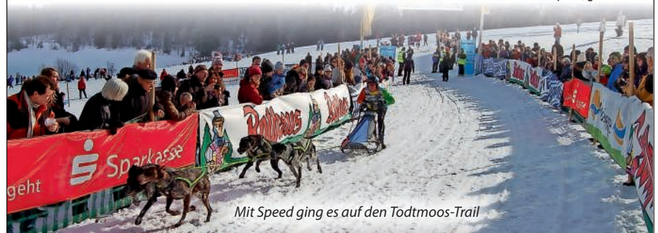
Mit Speed ging es auf den Todtmoos-Trail