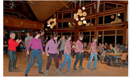
Spaß hatten die Besucher des Countryabends