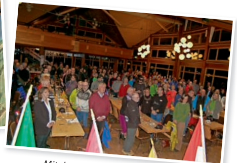
Mit der Deutschen Nationalhymne endete der offizielle Teil der Eröffnungsfeier