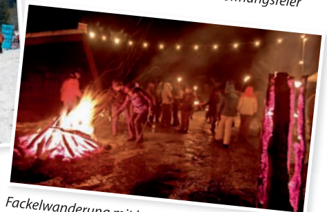
Fackelwanderung mit Lagerfeuer-Atmosphäre