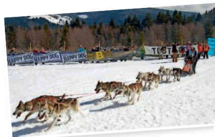
Immer noch Power hatten die Huskys von Angelika Merkel (D) nach dem Zieleinlauf