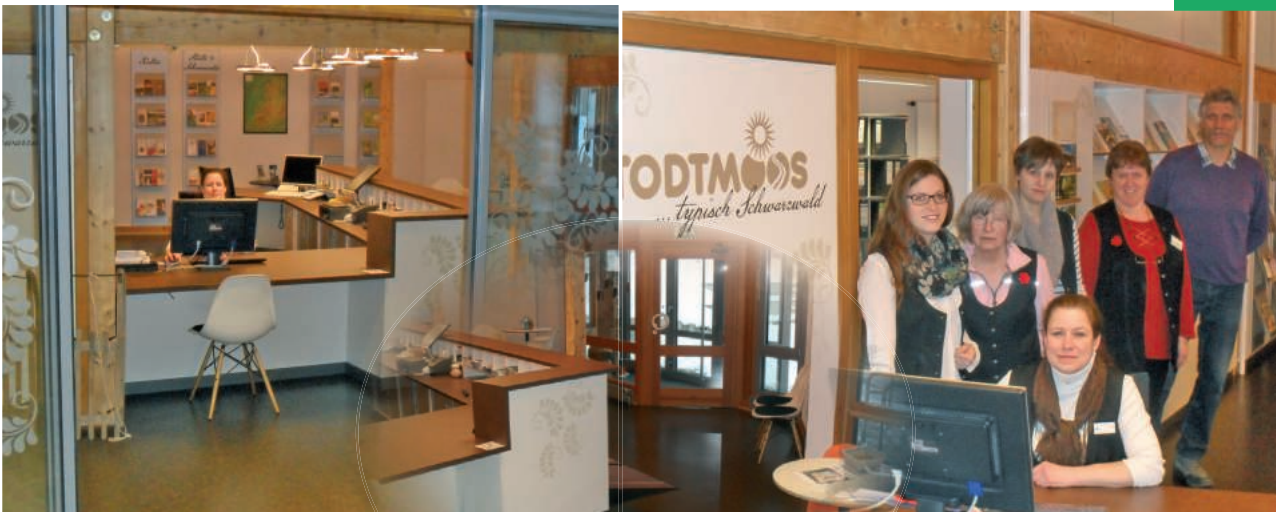
Die neu gestalteten Räumlichkeiten präsentieren sich hell und freundlich.