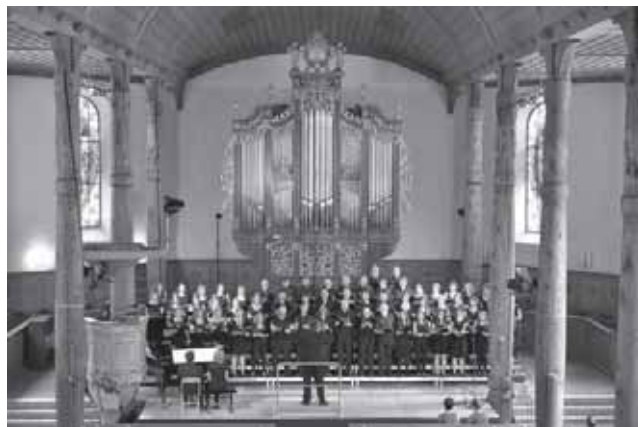
Der Chor der Universität Bern besteht aus rund 140 Sängerinnen und Sängern und wurde 1985 von ehemaligen Schülerinnen und