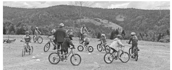
Die Kinder waren mit Eifer dabei

Den Auftakt hat unser Programm „Spaß auf dem Rad“ gemacht. Bei dem die Kinder spielerisch Balance und Koordination geübt haben.