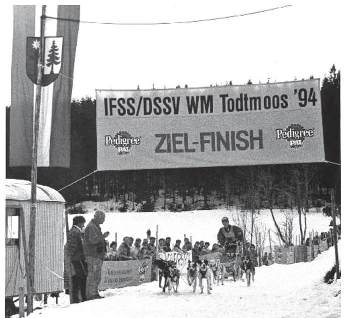
... und auch noch das letzte Gespann im Ziel zu erwarten.