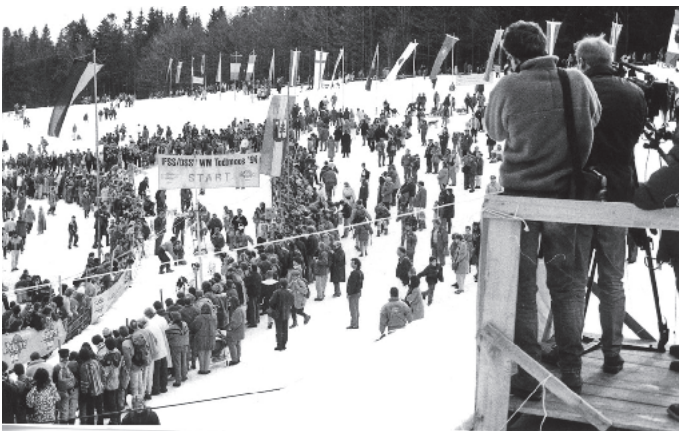
Fernsehteam auf dem Dach der „Hundehütte“