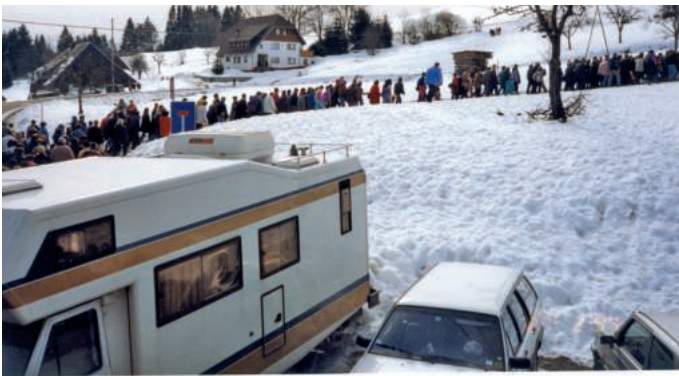
Menschenmassen strömten zur Rennstrecke