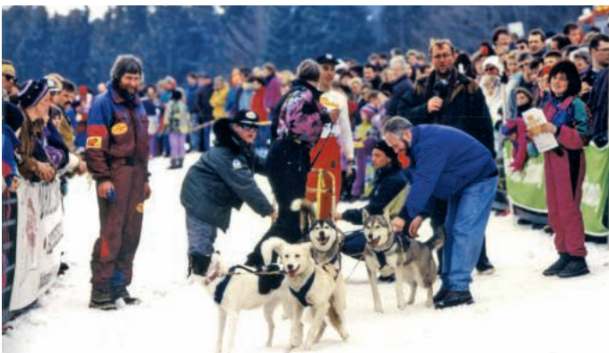
... um sich dann im Start-Ziel-Gebiet zu verteilen ...