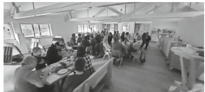
Der Jahresrückblick bei Kaffe,Kuchen und Getränken