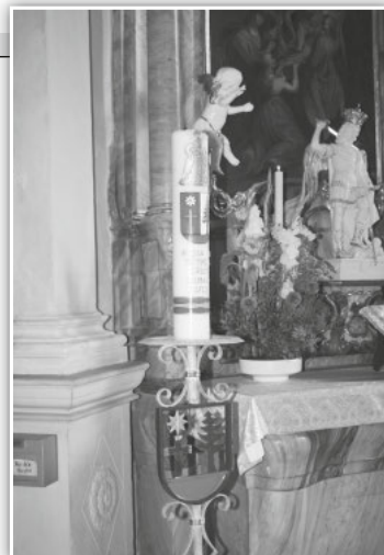
Jubiläumskerze am 19.08.2018