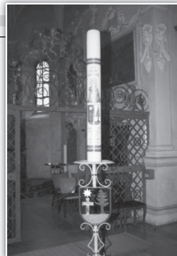
Jubiläumskerze am 04.03.2018

Zum Jubiläum haben wir die Deutsche Post mit der Ausgabe einer eigens gestalteten Briefmarke beauftragt. Sie kann im Bogen à 10 Stück im Rathaus in der Kasse erworben werden. Alle Interessenten können die Marken zum Selbstkostenpreis von 10 € erwerben. Haben Sie schon die Briefmarken an Ihre Familie, Freunde und Kunden verschickt?