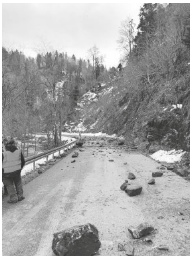
Gesprengetes Felsmaterial auf der Landesstraße

Zündung aus sicherer Entfernung: In fünf Sprenglöchern wurden insgesamt 500 Gramm Sprengstoff gefüllt und über ein elektronisches Zündkabel miteinander verbunden. Die kontrollierte Sprengung im abgesperrten Bereich wurde durch einen Fachmann vorgenommen und verlief nach Plan.