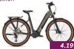
Entice 5.B Kalkhoff