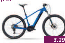
HardRay E 6.0 Raymon