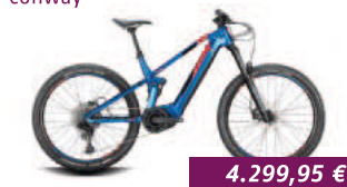
Xyron S 2.7 Conway