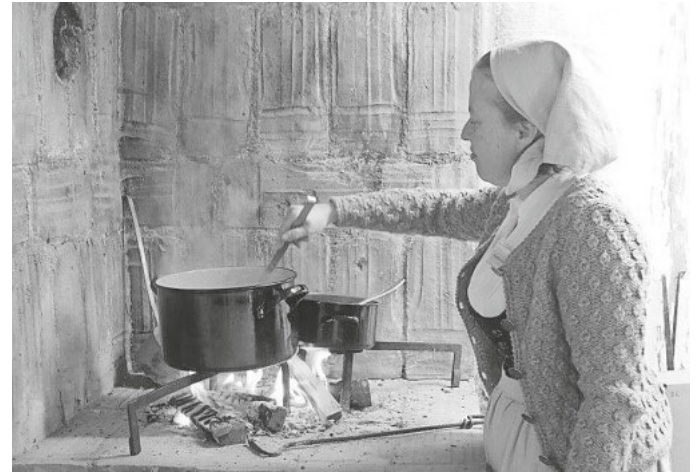
Raue Kost wird am Sonntag, 27. Oktober, in den historischen Küchen des Freilichtmuseum Neuhausen ob Eck gekocht. Kosten natürlich erlaubt!