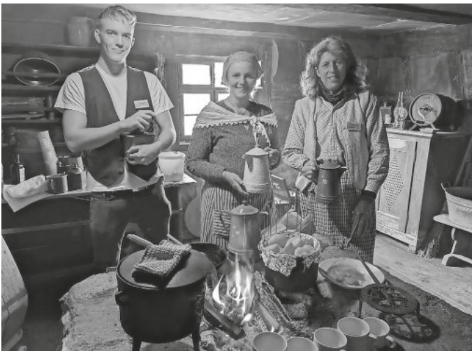
Rauhe Kost wird am Sonntag, 27. Oktober, in den historischen Küchen des Freilichtmuseum Neuhausen ob Eck gekocht. Kosten natürlich erlaubt!

Das Museum hat von 9 bis 18 Uhr geöffnet. Kinder bis 10 Jahre haben freien Eintritt. Eine Saisonkarte für Erwachsene kostet 25 Euro und bietet die ganze Saison freien Eintritt an jedem Öffnungstag und somit auch an jeder Veranstaltung.