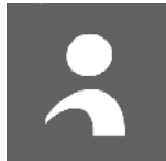
Für Empfängerin & Empfänger