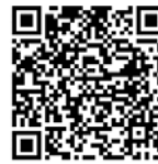
QR-Code Meldeplattform Asiatische Hornisse

Sichtungen von Einzeltieren und insbesondere Nester sollen weiterhin ausschließlich über die Meldeplattform der Landesanstalt für Umwelt gemeldet werden. Dies kann über die Homepage der Landesanstalt für Umwelt (LUBW) oder über die kostenlose „Meine Umwelt-App“ erfolgen: