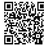
QR-Code Meine Umwelt-App

Die Landesanstalt für Bienenkunde der Universität Hohenheim prüft die eingehenden Meldungen und gibt bei Nestfunden den Meldenden weitere Instruktionen und unterstützt bei der Vermittlung von sachkundigen Personen für die Nestentfernung.