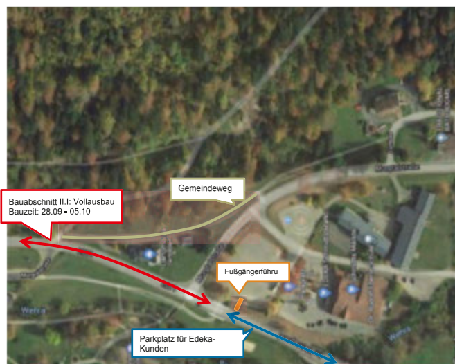
Abb. 1: Bauabschnitt II. I Vollausbau

Das Regierungspräsidium Freiburg bittet Verkehrsteilnehmer und Anwohner um Verständnis für die Verkehrsbehinderungen.