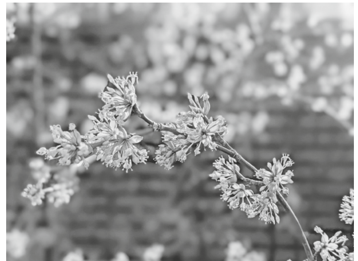
Die Kornelkirsche bietet Insekten im Gegensatz zur Forsythie viel Nahrung und blüht noch dazu besonders schön.