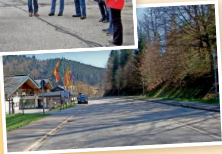
PKW-Stellplätze beim Kurhaus